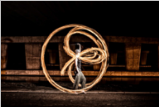
POI-Ballen aan kettingen